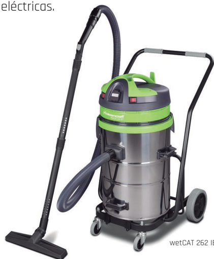
wetCAT 262 IET