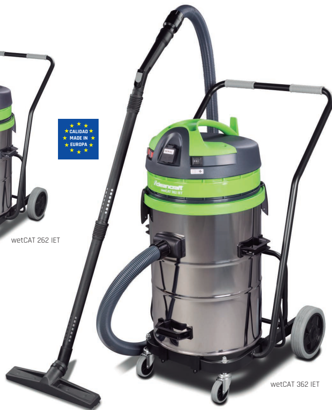
wetCAT 362 IET

Para polvo y partículas sólidas. LIMPIEZA AUTOMÁTICA DEL FILTRO. Conector para herramienta eléctrica, con arranque automático. Con depósito de acero inoxidable.