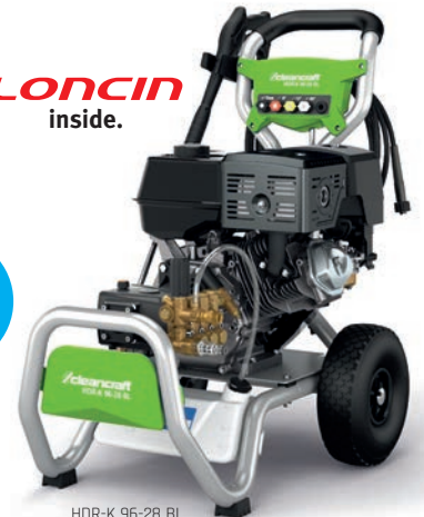
HDR-K 96-28 BL