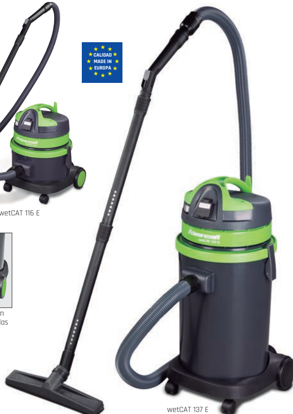
wetCAT 137 E