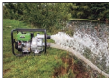
Hasta 966 l/min de agua sucia desde una profundidad de 7 m.