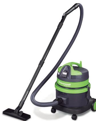
wetCAT 116 E