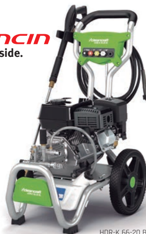
HDR-K 66-20 BL