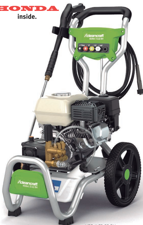
HDR-K 72-22 BH